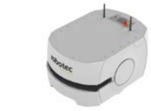
SRX I - DAS STARTERKIT ALS BASIS