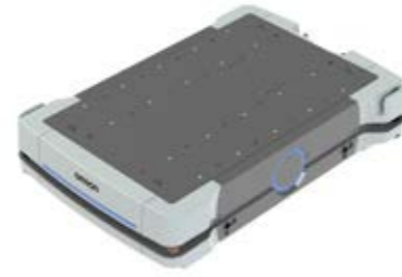
SRX - 1500 - I