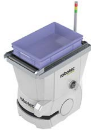
SRX III - DER GEBINDETRANSPORTER