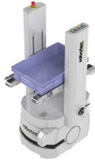
SRX VIII - DER GEBINDETRANSPORTER