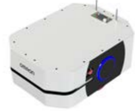
SRX - 250 - I