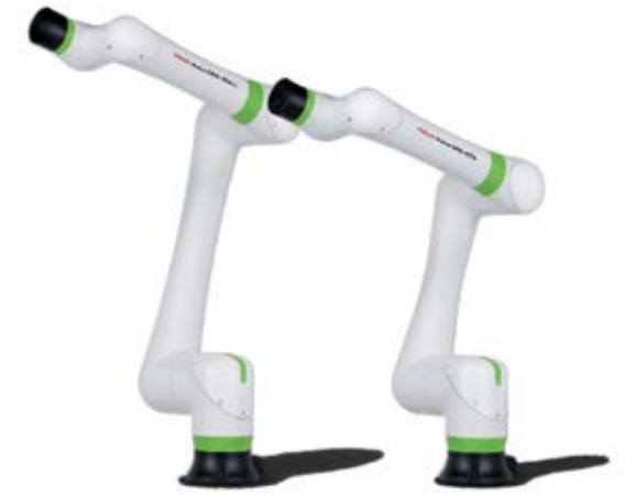
CRX - DER KOLLABORATIVE ROBOTER TECHNISCHE SPEZIFIKATIONEN