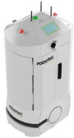
SRX VI - DER CABINET TRANSPORTER