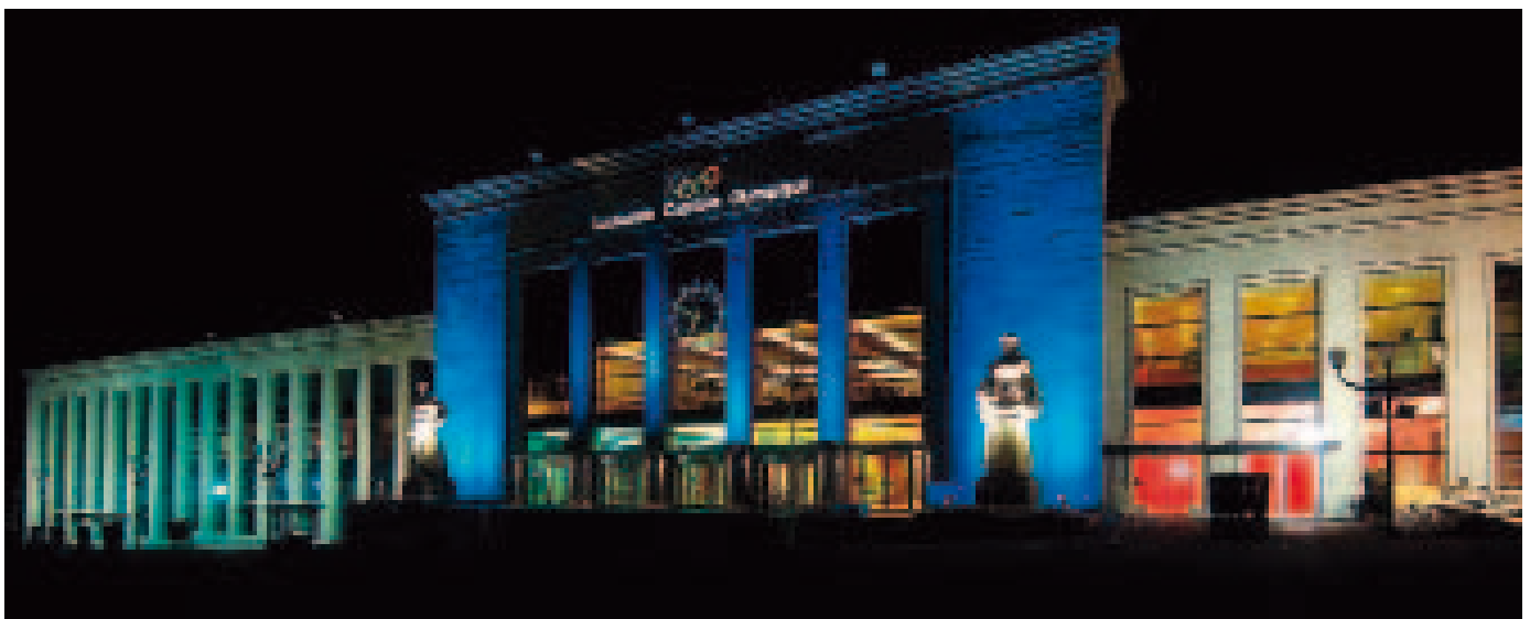
«Beaulieu by Night», la visite d'exposition telle l'EPHJ/EPMT ou SECURITE permet notamment de joindre l'utile à l'agréable par exemple en séjournant au bord du Léman pendant quelques jours.

Cette importante manifestation anglaise traite de la fabrication dans le domaine de la précision et des nanotechniques. Elle se déroule dans la «Ricoch Arena» à Coventry du 19 au 20 octobre 2010. 150 exposants