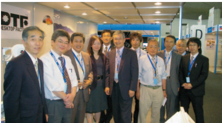
L'équipe japonaise de Desktop Factory ont cette année choisi qu'une seule exposition européenne, à savoir l'EPMT, c'est certainement un gage de qualité pour ce salon.

Ainsi ce salon spécialisé rassemblera à la fois les sous-traitants et les fabricants de