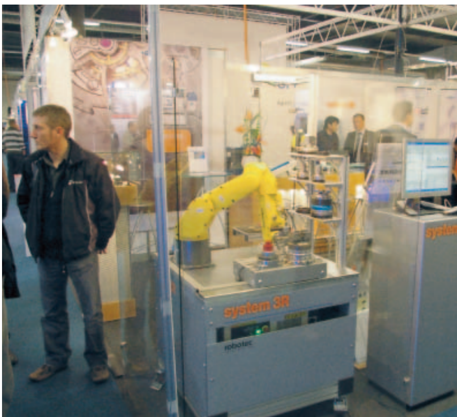
Le stand System3R avec une intéressante solution de robotique.